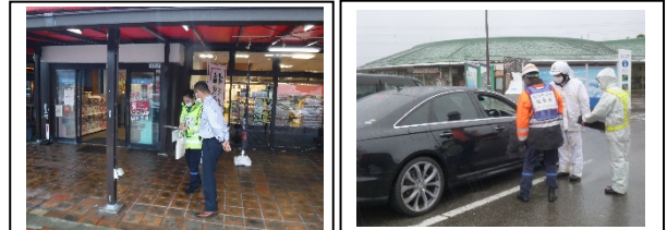
啓発状況写真(南条サービスエリア)