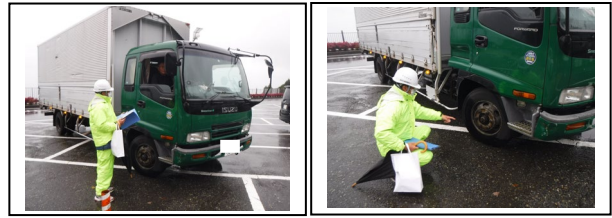
調査状況写真(道の駅「河野」)