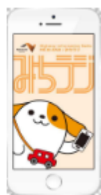
図-1 画面イメージ (アプリ起動時)