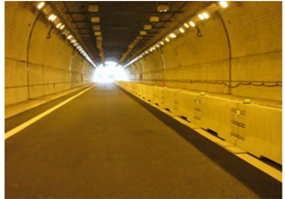
センターブロック※試行設置

〈参考〉暫定 2 車線の高速道路 区画柵の設置について(NEXCO 東日本、NEXCO 中日本、NEXCO 西日本)