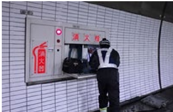
トンネル非常用設備点検