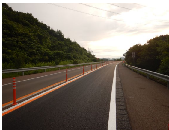
補修後のイメージ