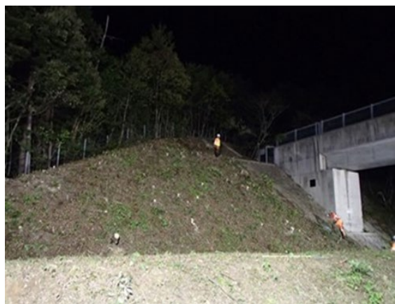
伐採後のイメージ