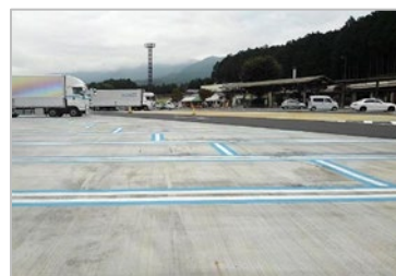
青色ラインでの「兼用マス」の明示例