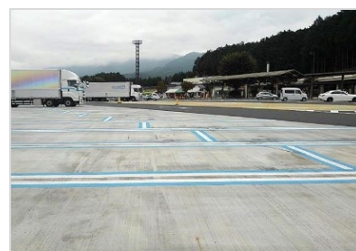
青色ラインでの「兼用マス」の明示例