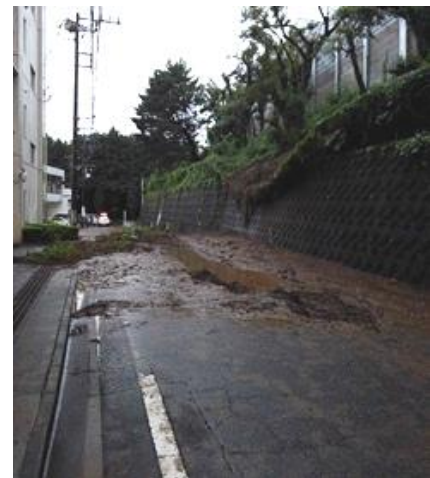
大和市道深見西18号の被災状況