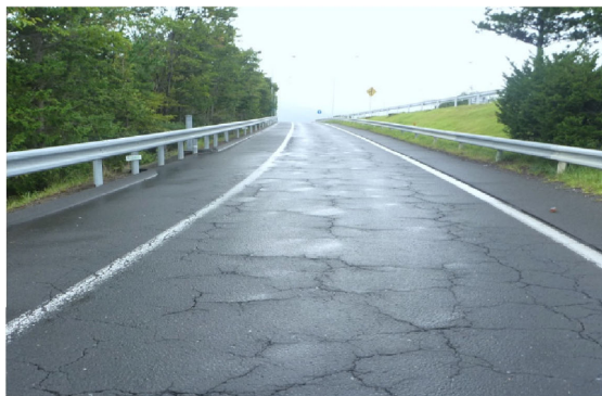
ひび割れた路面(イメージ)