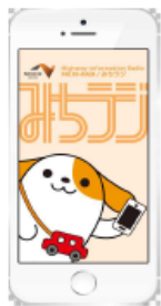
図-1 画面イメージ (アプリ起動時)

https://www.c-nexco.co.jp/pdf/common/michiradi02.pdf