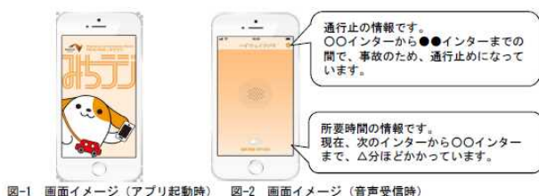
図-1 画面イメージ(アプリ起動時) 図-2 画面イメージ(音声受信時)