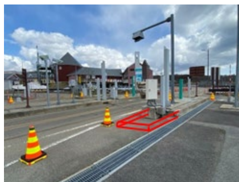
ETC 設備を設置する土台部の延伸工事