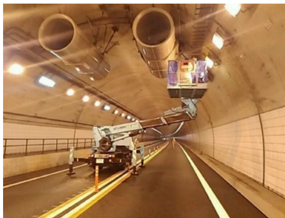
<トンネル設備点検状況>