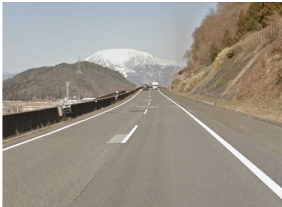
舗装損傷イメージ