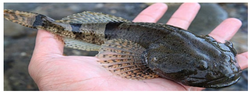
稀少淡水魚「アラレガコ」

館内には、「九頭竜川淡水魚ミニ水族館」も設置します。 九頭竜川のイワナ・ヤマメや、その生息地が国の天然記念物となっている稀少淡水魚「アラレガコ」などをご鑑賞いただけます。