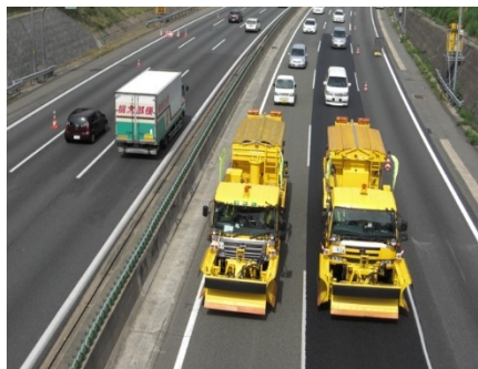
(セーフティーカー走行のイメージ)

交通規制箇所や渋滞末尾での減速や急ブレーキなどによる追突事故防止のため、あらかじめ先頭誘導のための警戒車両として、視認性の高いセーフティーカーを走行させます。お客さまの安全のためにも、セーフティーカーの走行にご理解とご協力をお願いいたします。