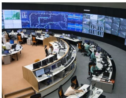
(24 時間監視の実施イメージ)

きめ細かな情報提供とお客さまの安全のために、交通規制区間に設置した渋滞計測機器を活用し、24 時間体制で道路状況を監視するとともに、情報板や渋滞末尾警戒車でリアルタイムの情報をお知らせいたします。