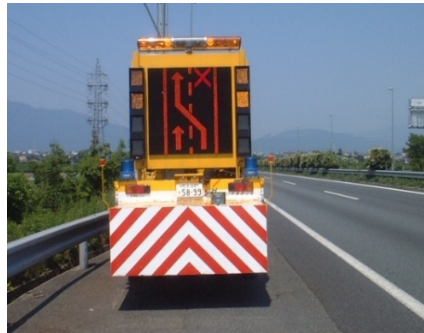
(渋滞末尾警戒車の配置例)

交通規制箇所や渋滞末尾での追突事故を防止するための注意喚起として、渋滞状況に応じて適切なポイントとタイミングで、交通規制箇所の手前または渋滞末尾付近の路肩に標識車を配置させていただきます。