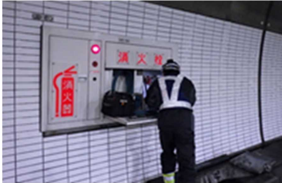
(トンネル非常用設備点検)