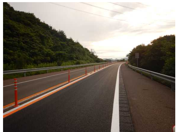
(補修後のイメージ)