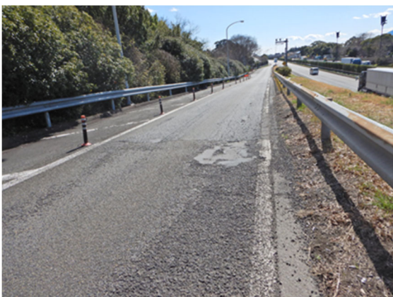
【日本平 PA(下り)ランプ損傷状況】