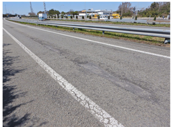
【牧之原 SA(下り)ランプ損傷状況】