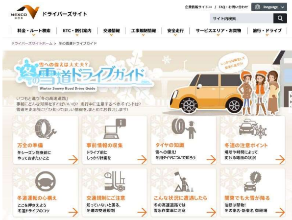
【WEB サイト 冬の雪道ドライブガイド】

冬道の注意するポイントや安全にご利用いただくための情報は、当社公式WEBサイト内の「冬の雪道ドライブガイド」[ https://www.c-nexco.co.jp/special/snow/ ]でご確認いただけるほか、SA・PAにてお配りしているリーフレット「NEXCO 中日本 冬道走行に気をつけガイド」でもご紹介しております。