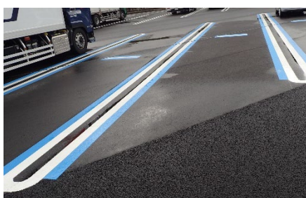
「兼用マス」の明示（イメージ）