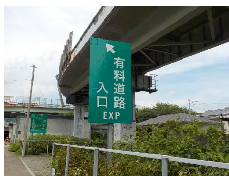
《有料道路入口看板設置イメージ》