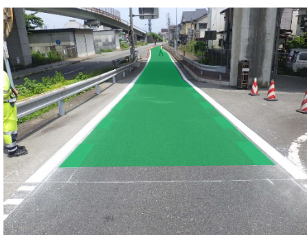
《高速道路入口車線への緑色着色イメージ》