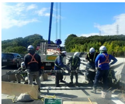
《橋梁伸縮装置の取替》