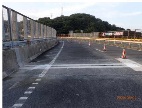
《伸縮装置取替後イメージ》