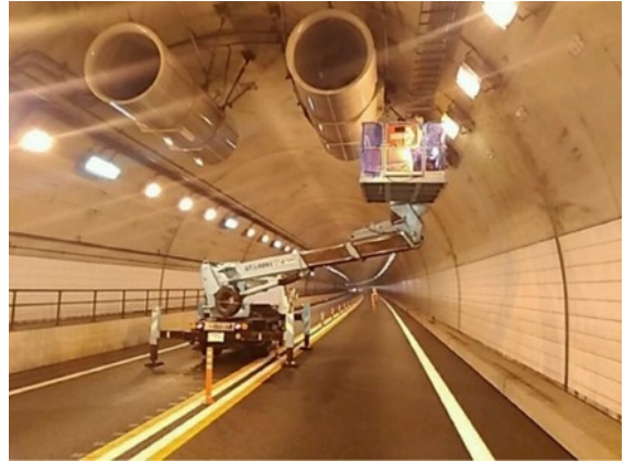
<トンネル設備点検状況>