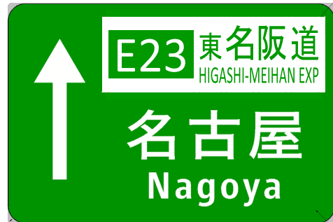
ナンバリング対応後