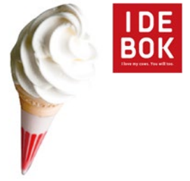
「いでほくソフトクリーム」