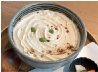
「白いカレーうどん」

富士山の麓にあるうどんの姓屋。「白いカレーうどん」は、雪化粧をした富士山をイメージしたもので、人気の一品。個性豊かなお料理をお楽しみください。