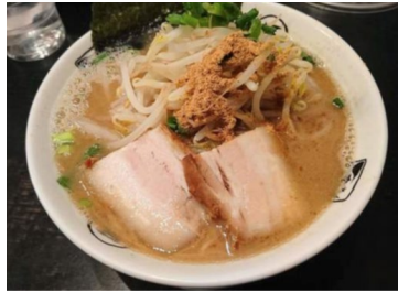
「大山とんこつラーメン」

富士山の麓を拠点に全4店舗※を展開。EXPASA 海老名(上り)でも人気のラーメン。駿河の国から情熱の一杯をお届けします。