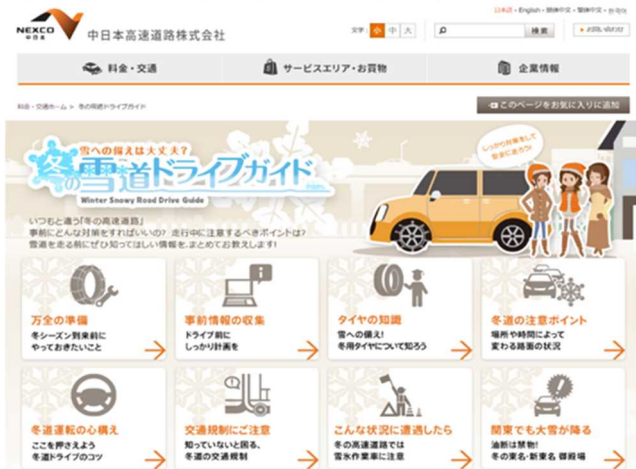
【WEB サイト 冬の雪道ドライブガイド】

冬道の注意するポイントや安全にご利用いただくための情報は、当社公式WEBサイト内の「冬の雪道ドライブガイド」[ https://www.c-nexco.co.jp/special/snow/ ]でご確認いただけるほか、SA・PAにてお配りしているリーフレット「NEXCO中日本 冬道走行に気をつけガイド」、「渋滞予測ガイド」でもご紹介しております。