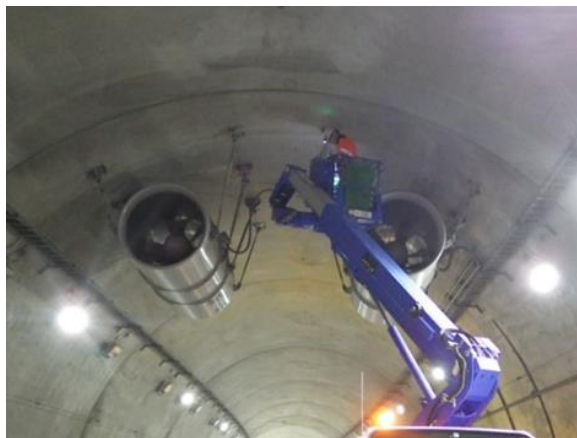
<トンネル設備点検状況>