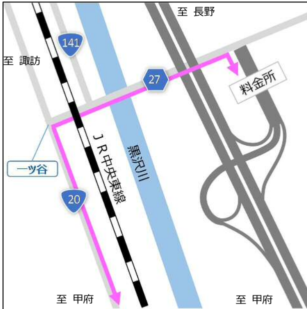
■ 韮崎 I C 周辺図