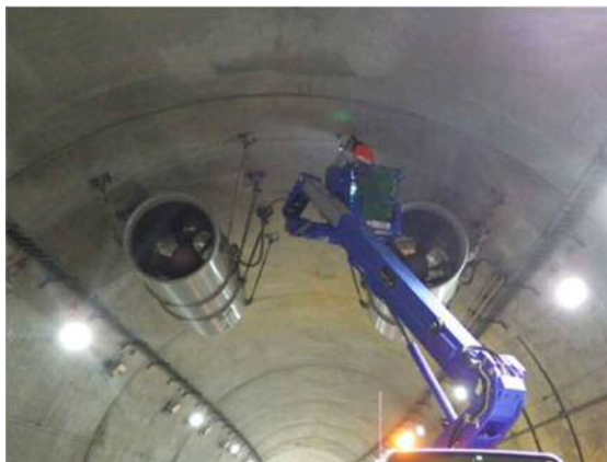
<トンネル設備点検>