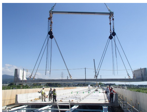
プレキャスト床版の施工状況