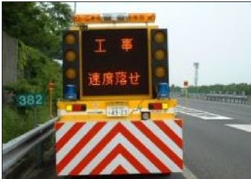
(渋滞末尾警戒車の配置例)

工事規制箇所や渋滞末尾での追突事故を防ぐため、渋滞状況に応じて、適切なポイントとタイミングで注意喚起をおこなうために、工事規制箇所の手前もしくは渋滞末尾付近の路肩に標識車を配置いたします。