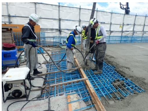
現場打ち床版の施工状況

工事期間を短縮するため、新しい床版は、工場で作成した製品（プレキャストコンクリート製品）を用いて工事を実施させていただきます。