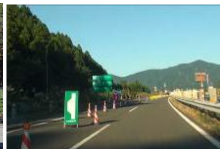
(非常駐車帯の設置例)