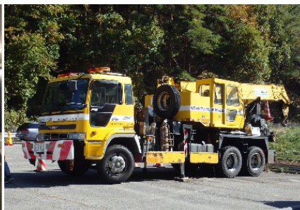
(レッカーなどの配置例)