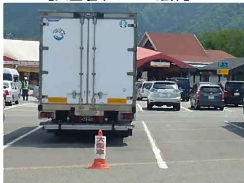
【大型駐車マスの確保】