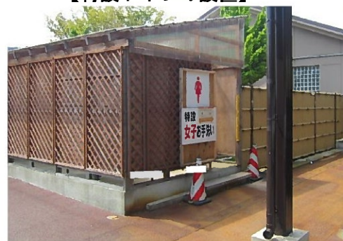
【特設トイレの設置】