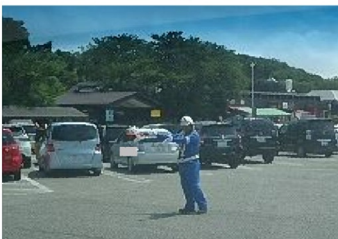
【休憩施設での駐車場整理員の配置】