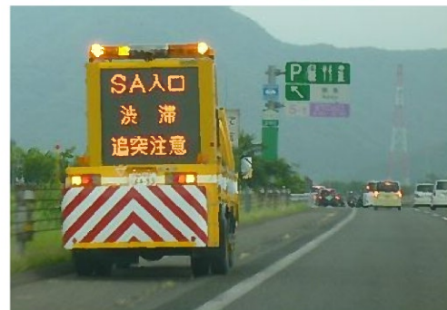
【渋滞末尾への追突注意喚起】