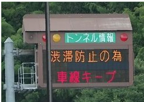
【トンネル入口部での渋滞防止注意喚起】