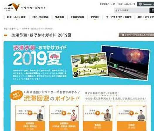
【Web サイト [ https://www.c-nexco.co.jp/odekake/ ]】