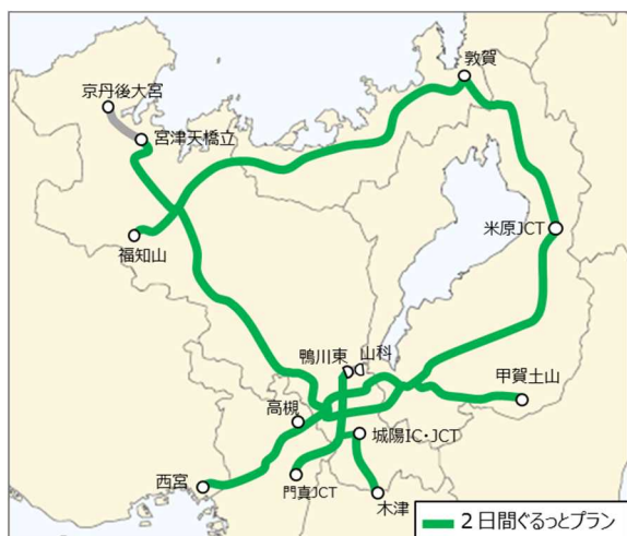
2 日間ぐるっとプラン