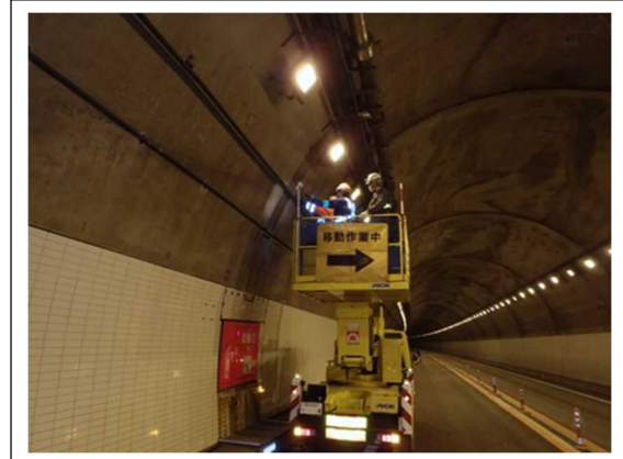
(トンネル照明設備点検)