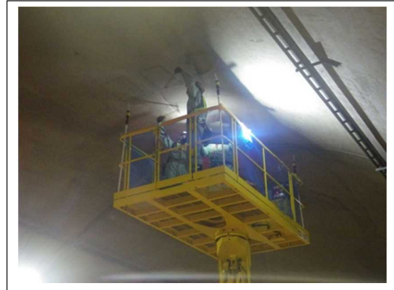
(高所作業車を用いたトンネル点検)