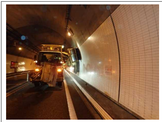
(トンネル側壁清掃)