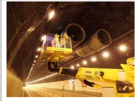
(トンネルジェットファン点検)