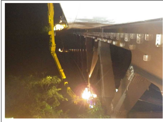
(橋梁点検車を用いた橋梁下面および橋桁の点検)