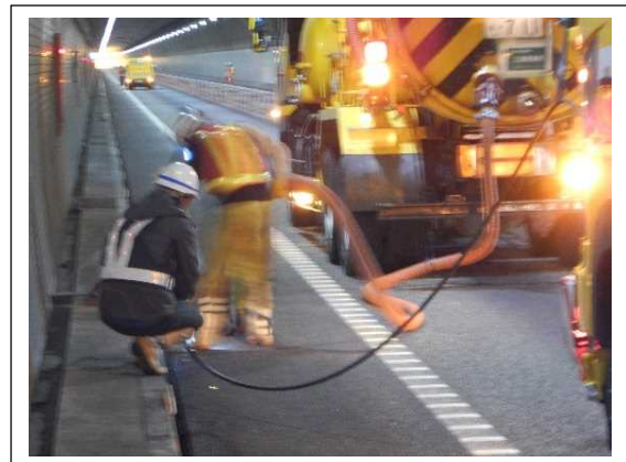
(トンネル円形水路清掃)