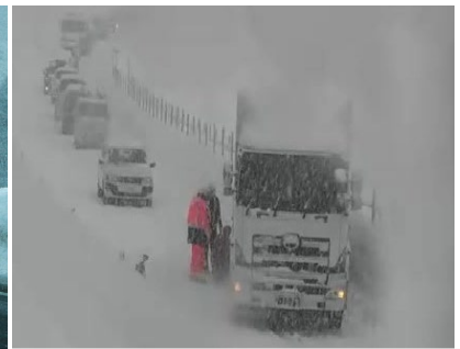
【走行不能車両による滞留】