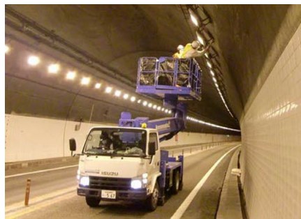
【通行止めによるトンネル内の点検】