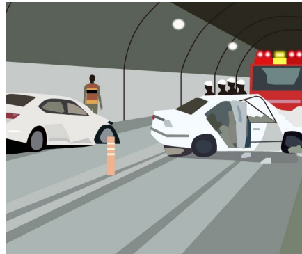
【対向車線への飛び出し事故】