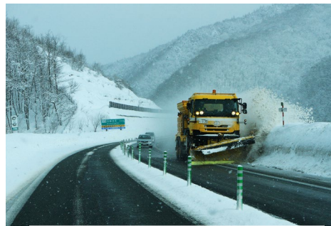
【大雪による狭い道路幅】