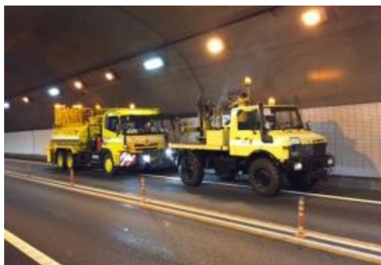
(トンネル壁面清掃)