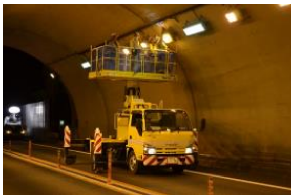
(トンネル照明点検)