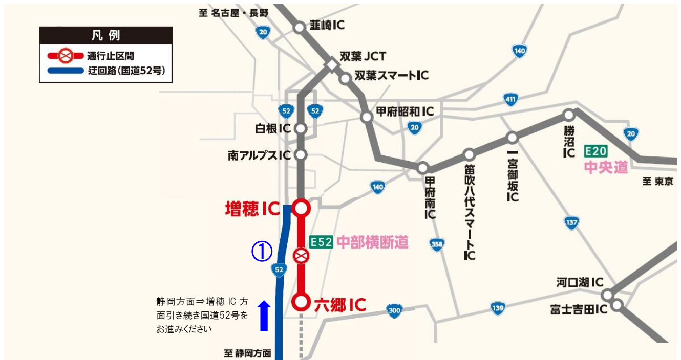
○増穂インターチェンジ付近詳細図