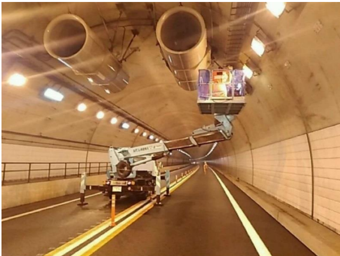
トンネル換気設備(ジェットファン)点検