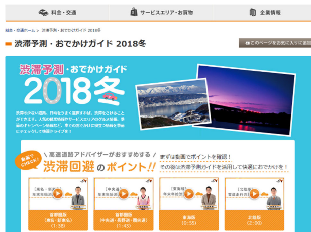
【WEB サイト 渋滞予測・お出かけガイド 2018 冬】

時間帯ごとの渋滞長、渋滞ピーク時の時刻、「高速道路ドライブアドバイザー」による渋滞回避のポイントについてご確認ください。計画的なご利用にご協力をお願いいたします。