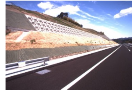
現況写真(構造物6車線対応区間)