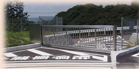
復旧拠点となるスペースの提供