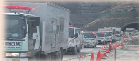
緊急開口部の活用