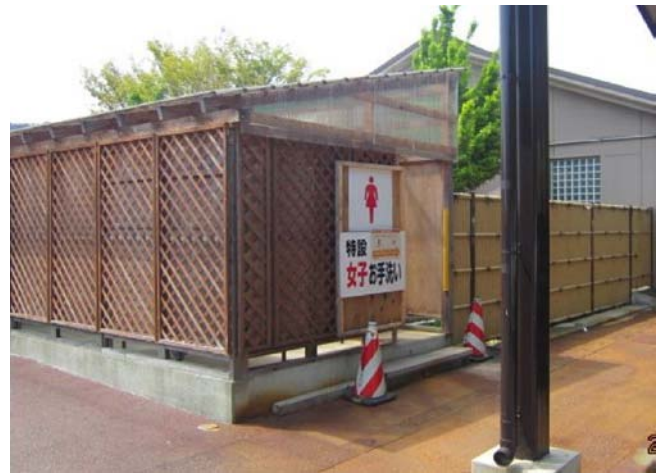
【特設トイレの設置】