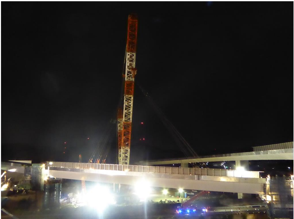
架設工事のイメージ（東名阪自動車道 四日市 JCT）