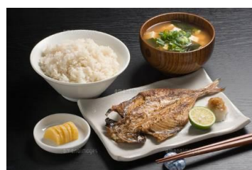
日本海一夜干し定食 1,500円[税込]