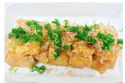
あげのやいたん 480 円[税込]

あぶらげ消費量日本一の福井県。 ヘルシーで高蛋白な油揚げ料理で 心と体を癒して下さい。