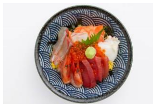
越前地磯丼 1,650円[税込]