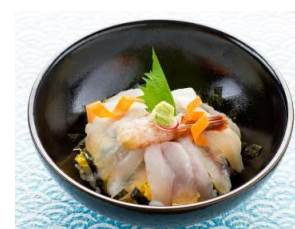
本日の獲れたて丼 1,600円[税込]