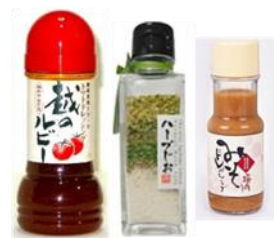
地元素材のドレッシング