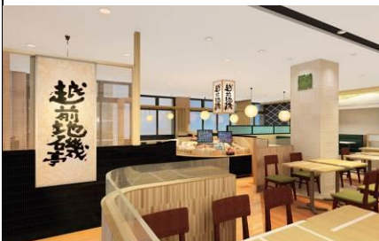
『越前地磯亭』 イメージ

南条SAの位置する南越前町は三町合併により生まれ、「山・海・里」の町と呼ばれる程、山の幸、海の幸、里の幸に恵まれた地域です。日本海の豊かな食材を利用し海鮮レストランに相応しいメニューをご提供いたします。