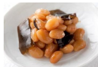
南条特製 めし友&おつまみ