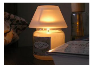
ヤンキーキャンドル