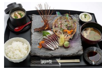
塩屋港直送 幻のアジ定食 1,850円[税込]