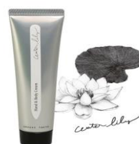
グラストウキョウのハンドクリーム