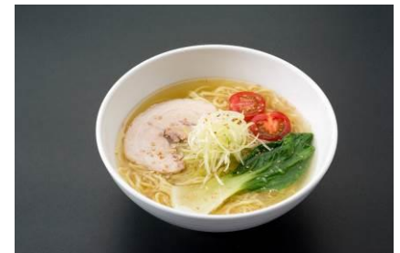
元祖 越前塩中華 650 円[税込]