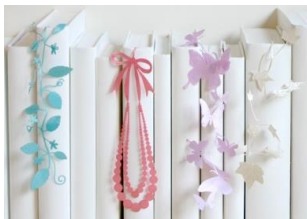
福井リボンメーカーしおりボン

季節ごとに、風鈴、酒器、ミニ盆栽など産地との共同催事で旬な北陸をアピールします。