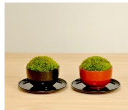
盆栽×越前塗「ちょこぼん」