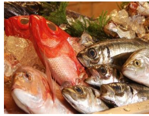
宅配商品イメージ