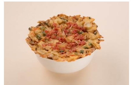
おぼろあげそば/うどん 970 円[税込]

澄んだ琥珀色の関西風うどんと そば粉 100%の越前そばの食べ比べを お楽しみください。