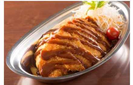
あとがけデミグラ ポルガライス 950 円[税込]