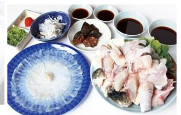
南条オリジナルふぐ鍋セット