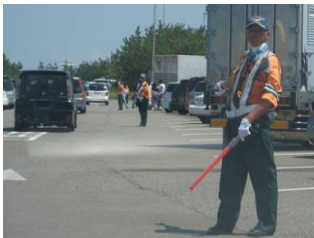
【休憩施設での駐車場整理員の配置】