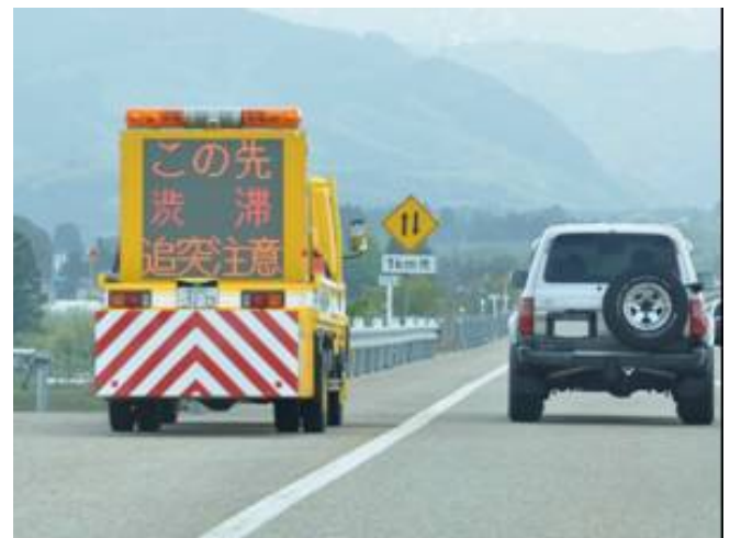
【渋滞末尾への追突注意喚起】