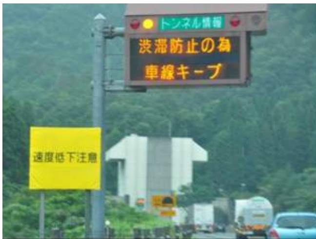
【トンネル入口部での速度低下注意喚起】