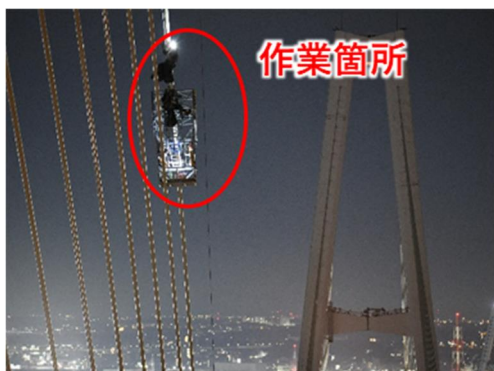
ロープ高所作業の状況(遠景)