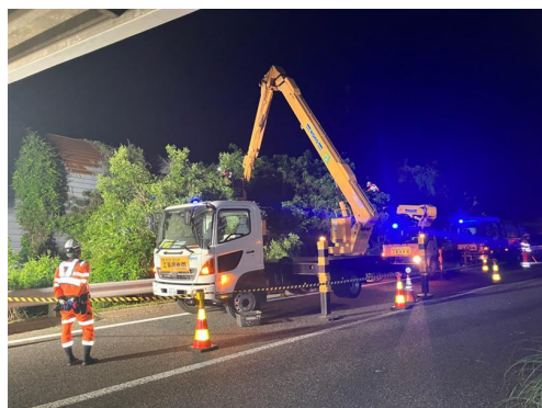
樹木の せんてい 剪定