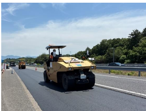
新しい舗装の舗設