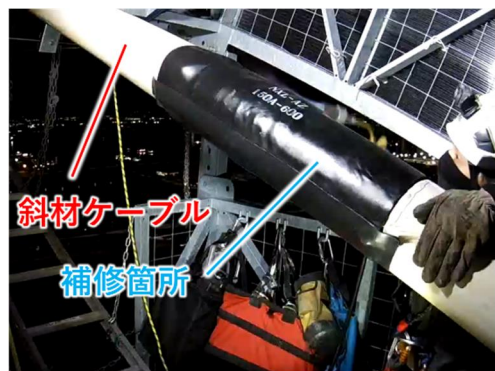
ロープ高所作業の状況(近景)