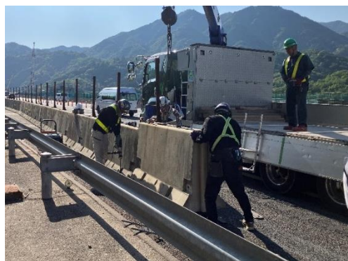
車線を拡幅するために必要となる 仮設防護柵の設置