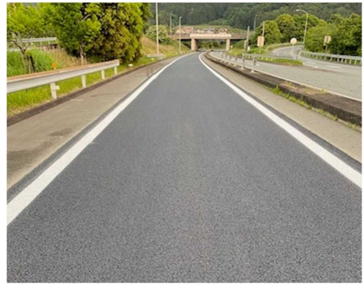
<舗装補修後の状況>