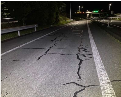
<舗装補修前の状況>