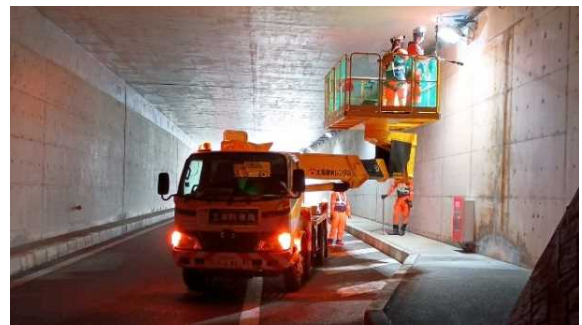
＜伊勢トンネルの照明設備の点検・清掃＞