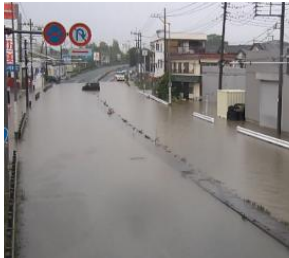
令和5年6月 埼玉県越谷市 国道4号