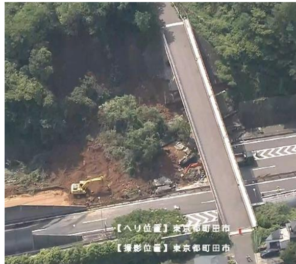
令和5年6月 東京都町田市 国道16号