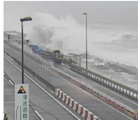
令和元年9月 神奈川県大磯町 国道1号