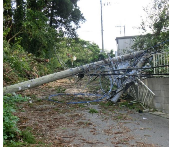
令和元年9月 千葉県山武市 山武市道