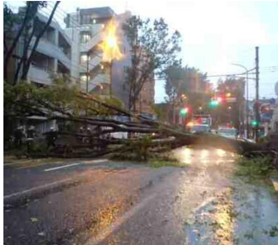
令和元年9月 東京都世田谷区 国道20号