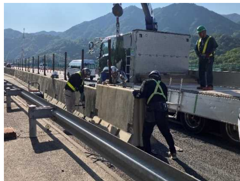
車線を拡幅するために必要となる 仮設防護柵の設置