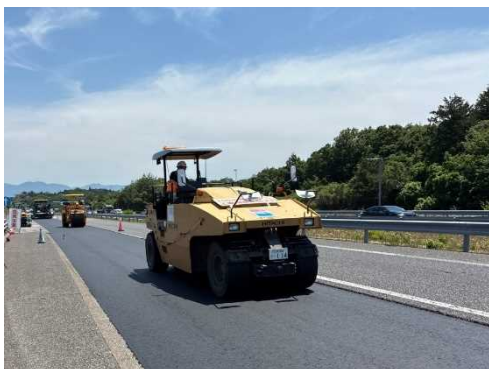
新しい舗装の舗設