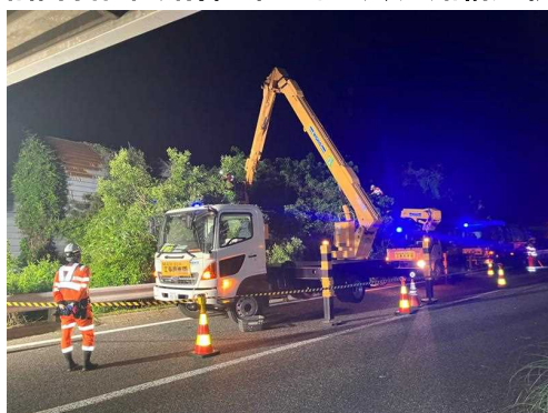
樹木の せんてい 剪定