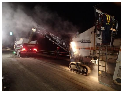
路面補修工事(イメージ)