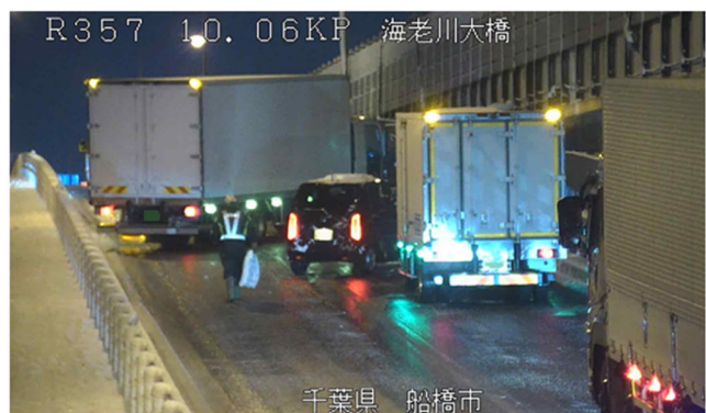
冬用タイヤやチェーン未装着車両による スリップ事故