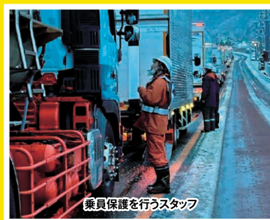
令和7年3月 山梨県内国道20号における 車両滞留の発生状況