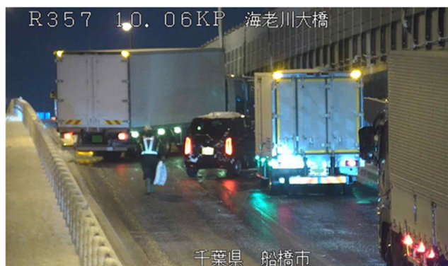
冬用タイヤやチェーン未装着車両による スリップ事故