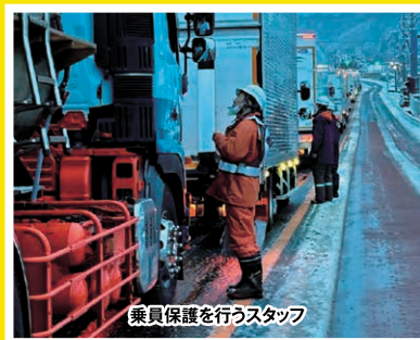
令和7年3月 山梨県内国道20号における 車両滞留の発生状況