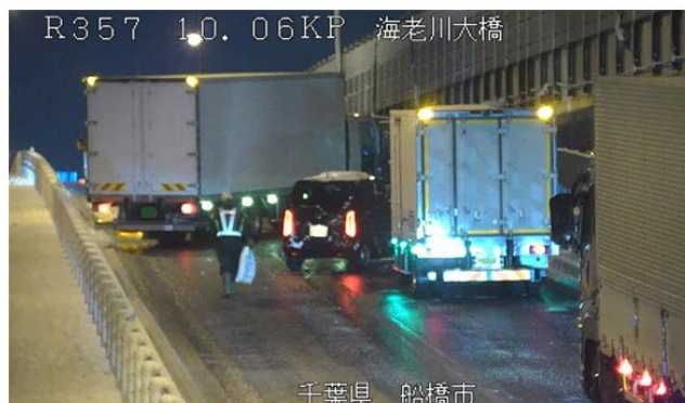
冬用タイヤやチェーン未装着車両による スリップ事故